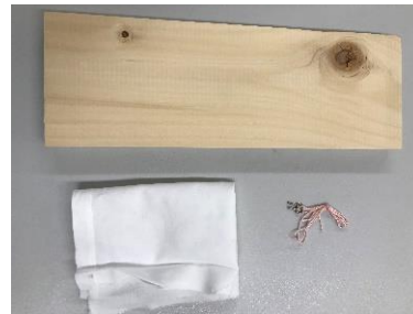
焼き板・ひも・布きれ